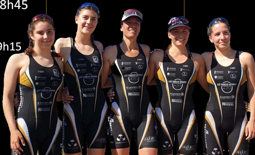
Team Beach Girls D3

Infos licence et renouvellement sur www.fftri.com/pratiquer/se-licencier/prendre-sa-licence-en-ligne